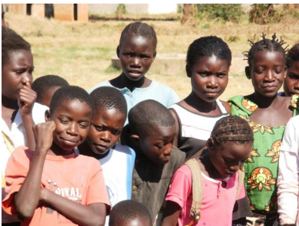
Een aantal kinderen van de school in Isoka

De lagere school is gratis voor alle kinderen. Toch kunnen lang niet alle kinderen naar school, want wel zijn schooluniformen, schoenen, schriften en schrijfgerei nodig. Voor de kinderen op de middelbare school moet bovendien schoolgeld betaald worden.